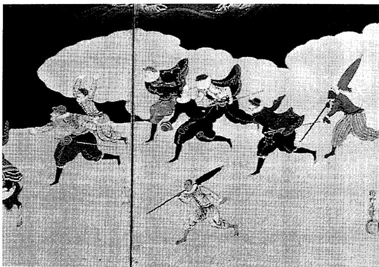
図3 狩野内善作「南蛮人渡来図屏風(左半双)」神戸市立博物館蔵(松田毅一監修・東光博英『日本の南蛮文化』淡交社、1993年、31ページ)

やはり膝が伸びている(図5)。絵画資料だけからみると、一般に朝鮮人の立位は膝が伸びていたという仮説が提示できそうだ。ただし朝鮮人が日本人を描いた絵画資料は、いまのところ管見に入っていない。この段階では、日本人の姿勢についてはまだ結論を提示することができない。