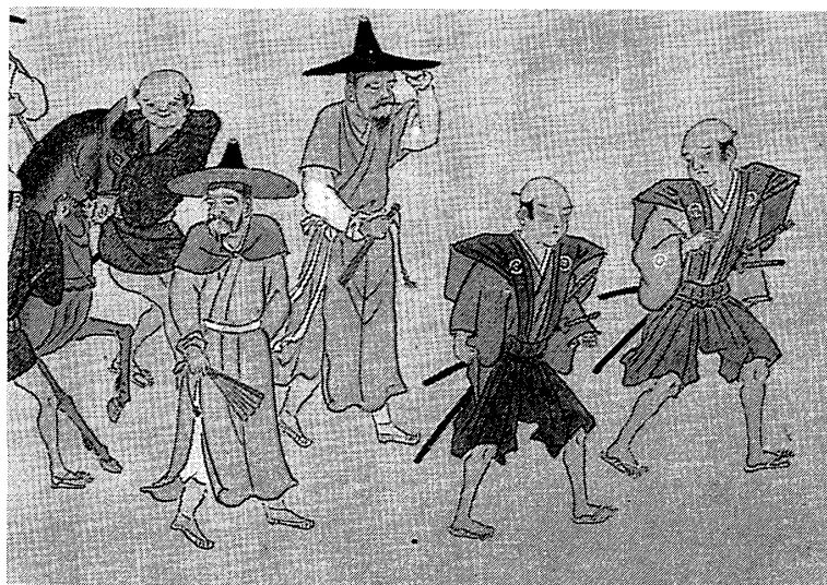
図4 江戸中期以降の通信使の様子を描いた「朝鮮通信使行列絵巻」天理ギャラリー蔵(天理大学附属図書館編『天理ギャラリー第38回展: 朝鮮通信使と江戸時代の人びと』天理ギャラリー、1988年、38ページ)