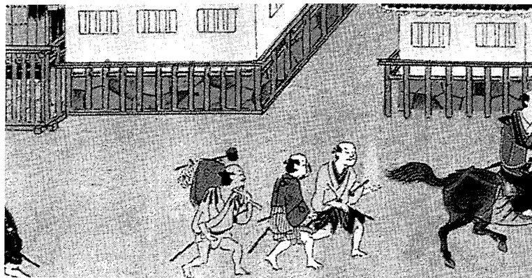
図1 1600年代前半の江戸の様子を描いた「江戸図屏風(左隻)」国立歴史民俗博物館蔵(小澤弘・丸山伸彦編『図説江戸図屏風をよむ』河出書房新社、1993年、27ページ)

明治以前の絵画を通観すると、日本人がかつて自分たちの歩き方を「ナンバ」で表現することが驚くほど多かったことがわかる(図1)。場