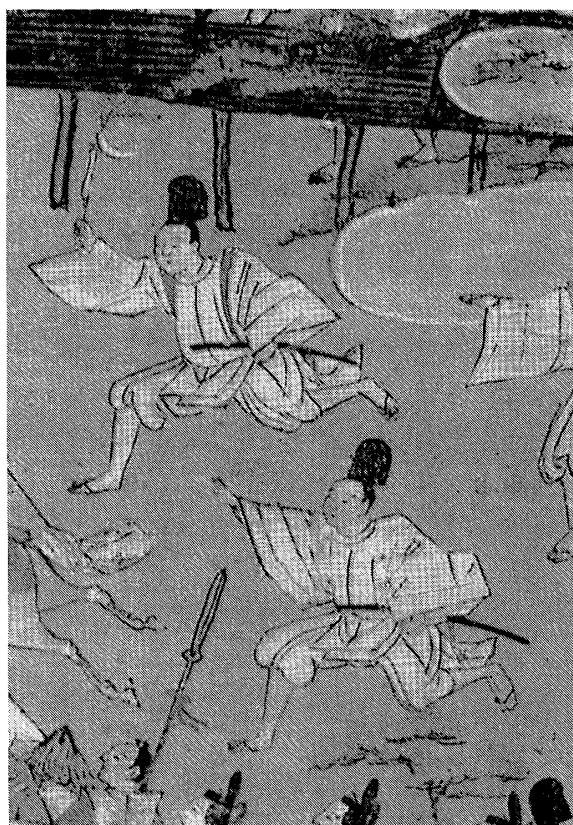
図2 「月次風俗図屏風」東京国立博物館蔵，室町時代，16世紀（徳川美術館編『美術に見る日本のスポーツ』徳川美術館，1994年，32ページ）

合によっては、走るときさえ「ナンバ」のままである（図2）。さらに指摘できるのは、歩くときも立位するときも、たいてい膝が曲がったまま（＝かりに「膝折り姿勢」と呼ぶ）であることだ。武士も商人も農民も、この点には変わりがない。古来の日本人が「ナンバ」歩きであったと主張される根拠は、おおむねこうした絵画資料に依っている場合が多い。